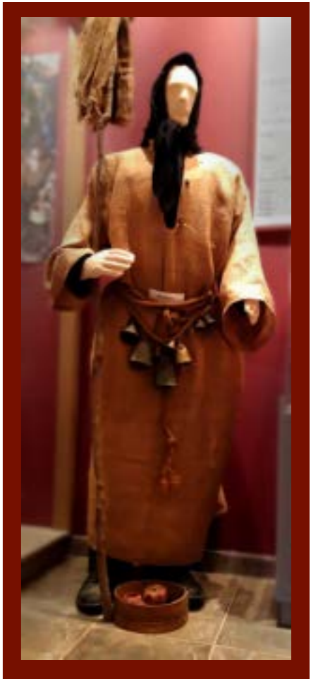
Ο Καλόγερος του Κωστή στη Μελίκη