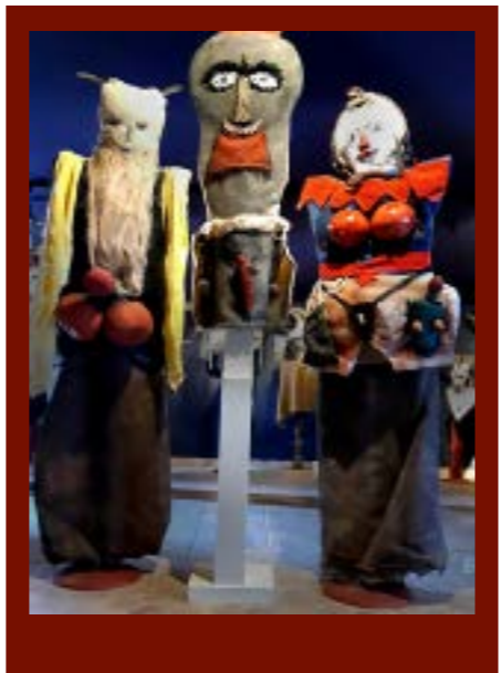
Ο Αρχικαλόγερος με τον Πολύσπορο και την Πολυσπορίτσα στη Βυζή της Θράκης.